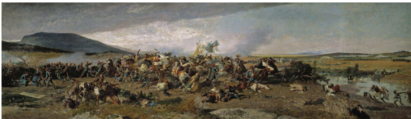
Mariano Fortuny. La batalla de Wad-Ras , 1860-1862. Museo del Prado.