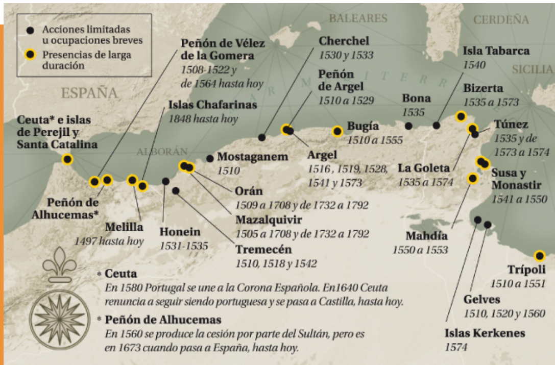
Mapa de los enclaves españoles en el norte de África entre 1497 y 1848.

Durante siglos, sobre todo durante la época musulmana y después, a partir de la conquista del reino de Granada, España ha estado estrechamente vinculada al norte de África, mediante el establecimiento de numerosos enclaves en la costa. Pues bien, a mediados del siglo XIX, durante ocho meses el país estuvo inmerso en un conflicto bélico, llamado “Guerra de África. La historiografía marroquí se refiere a este conflicto como “La Guerra de Tetuán” o la “Guerra hispano-marroquí”, mientras la inglesa y francesa se inclinan por “campana de Marruecos”. En España, si al principio se habló de “La Guerra del Rif”, pronto, lo demuestra la abundante bibliografía de la época, se generalizó la denominación “Guerra de África”).