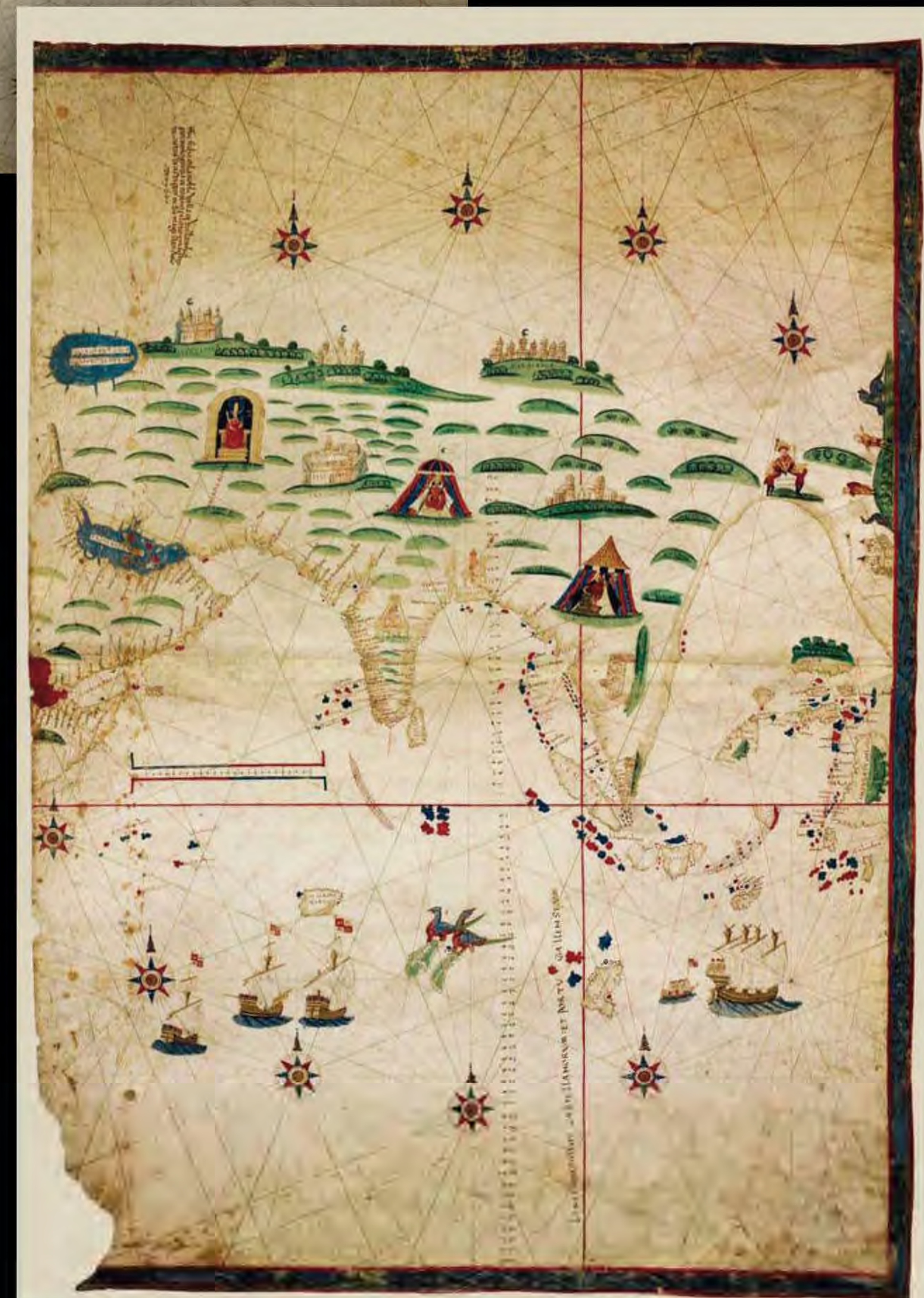
Nuño García de Toren "Mapa de las Molucas" (1522), Biblioteca Nacional de Francia