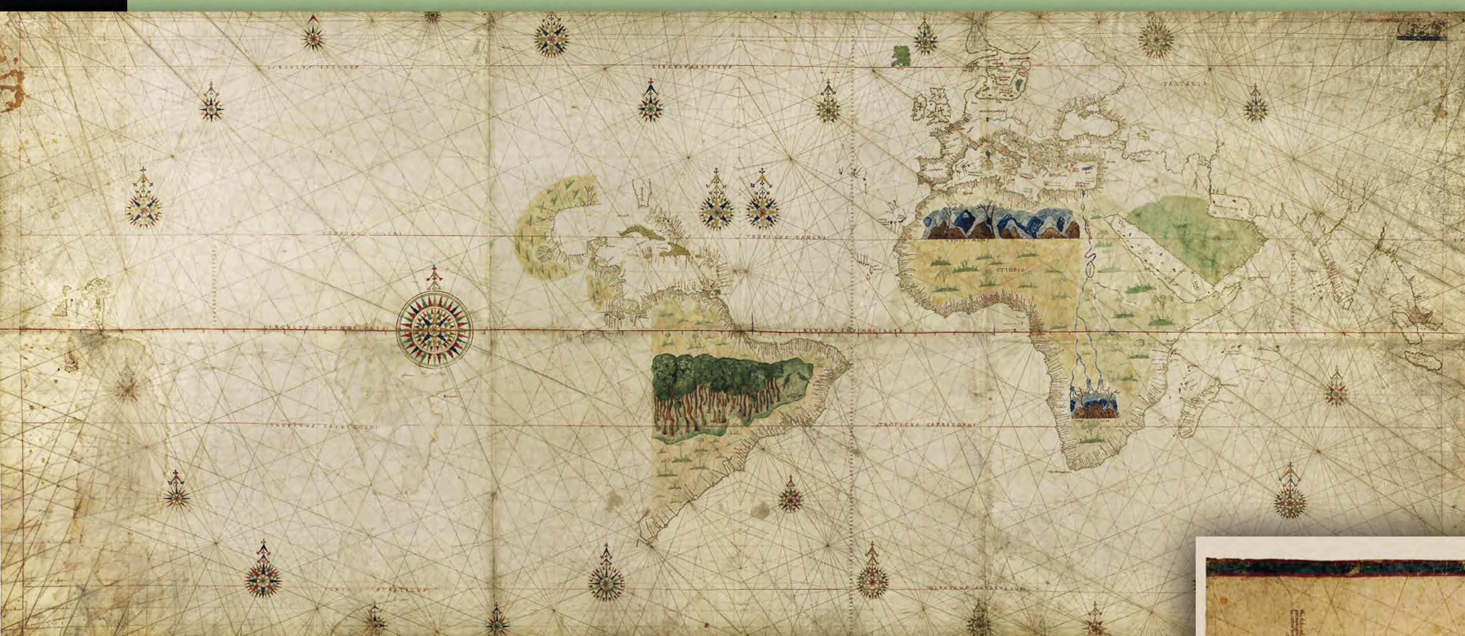
Juan Vespucci "Geocarta Náutica Universal" (1523), Biblioteca Real de Turín

El 21 de octubre de 1520 entraron en el deseado estrecho. El capitán mandó dos naves a explorar la zona, la Concepción y la San Antonio. Esteban Gómez, piloto de la última, decidió desertar y regresar a España, al comprobar que había paso interoceánico. Las tres naos restantes, Trinidad, Concepción y Victoria, entraron por fin al estrecho al que llamaron entonces de Todos los Santos. Magallanes ha descubierto felizmente que el ansiado pasaje existe. Pasaron el mes de noviembre explorándolo, y el 27 los viajeros vislumbran el final, la salida a mar abierto; no es por tanto gratuito el nombre que le pusieron al último saliente de tierra, Cabo Deseado. Ascendieron por la costa chilena, desde donde viraron hacia el Oeste y penetraron en el océano Pacífico.