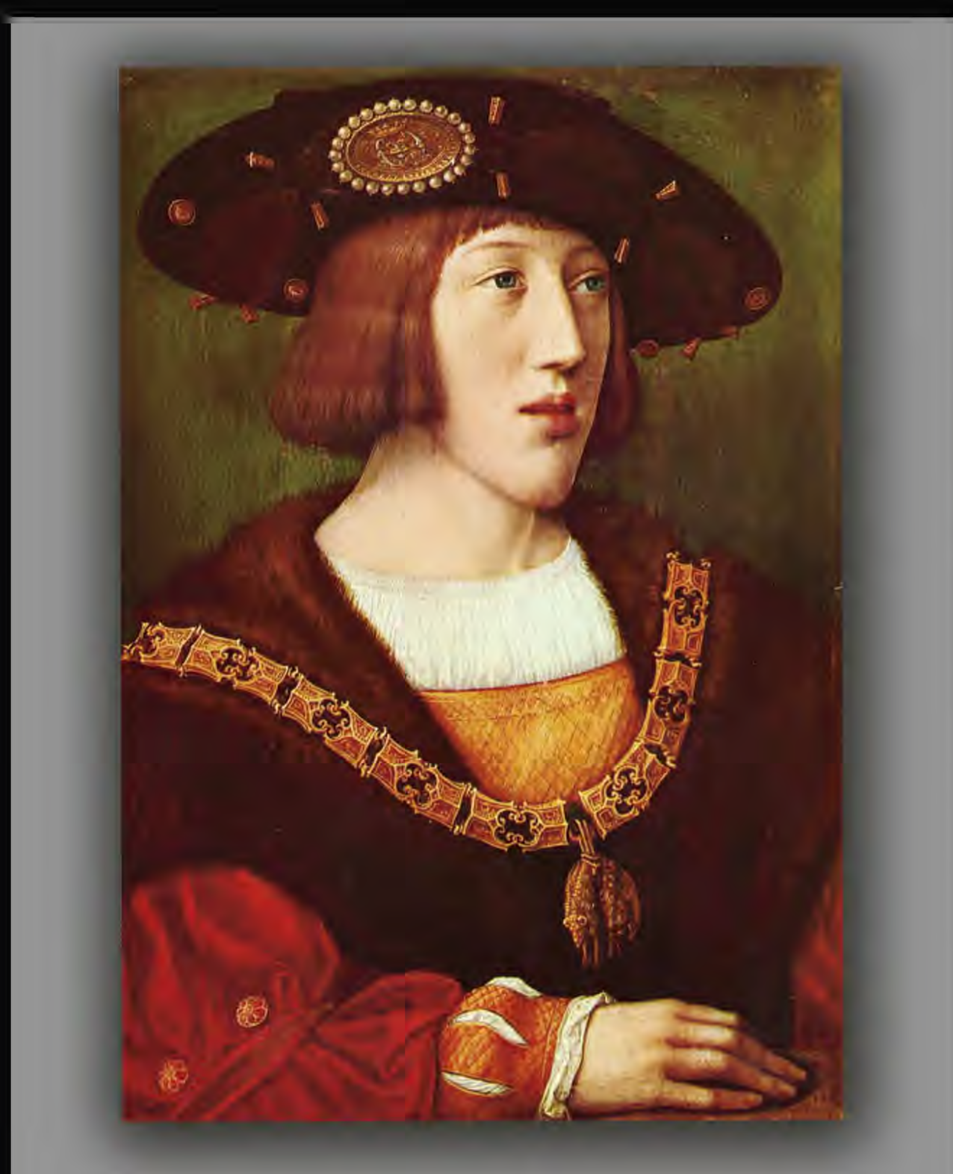
Bernart van Orley "Carlos I" (1516), Museo del Louvre