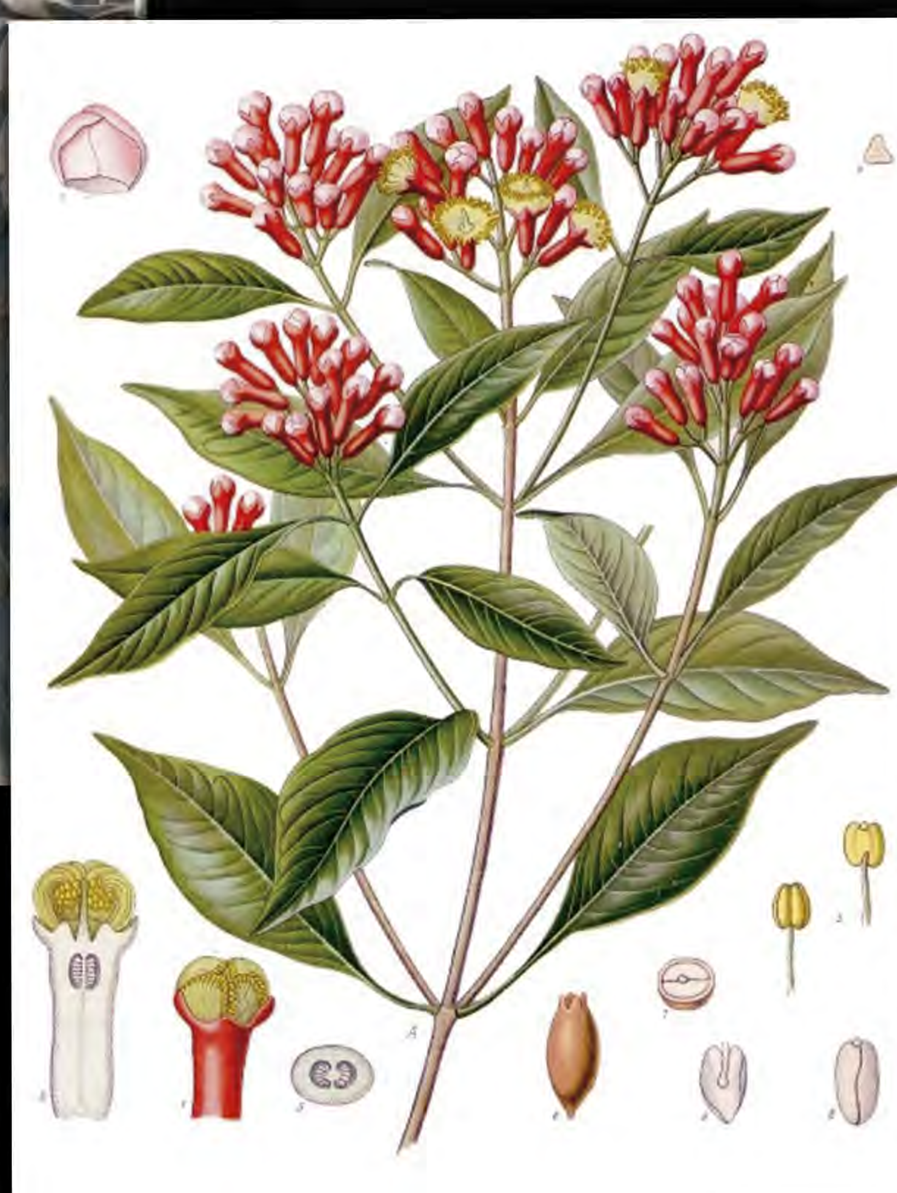
Árbol del clavo ( Syzygium Aromaticum ), Mc Cormick, 1915