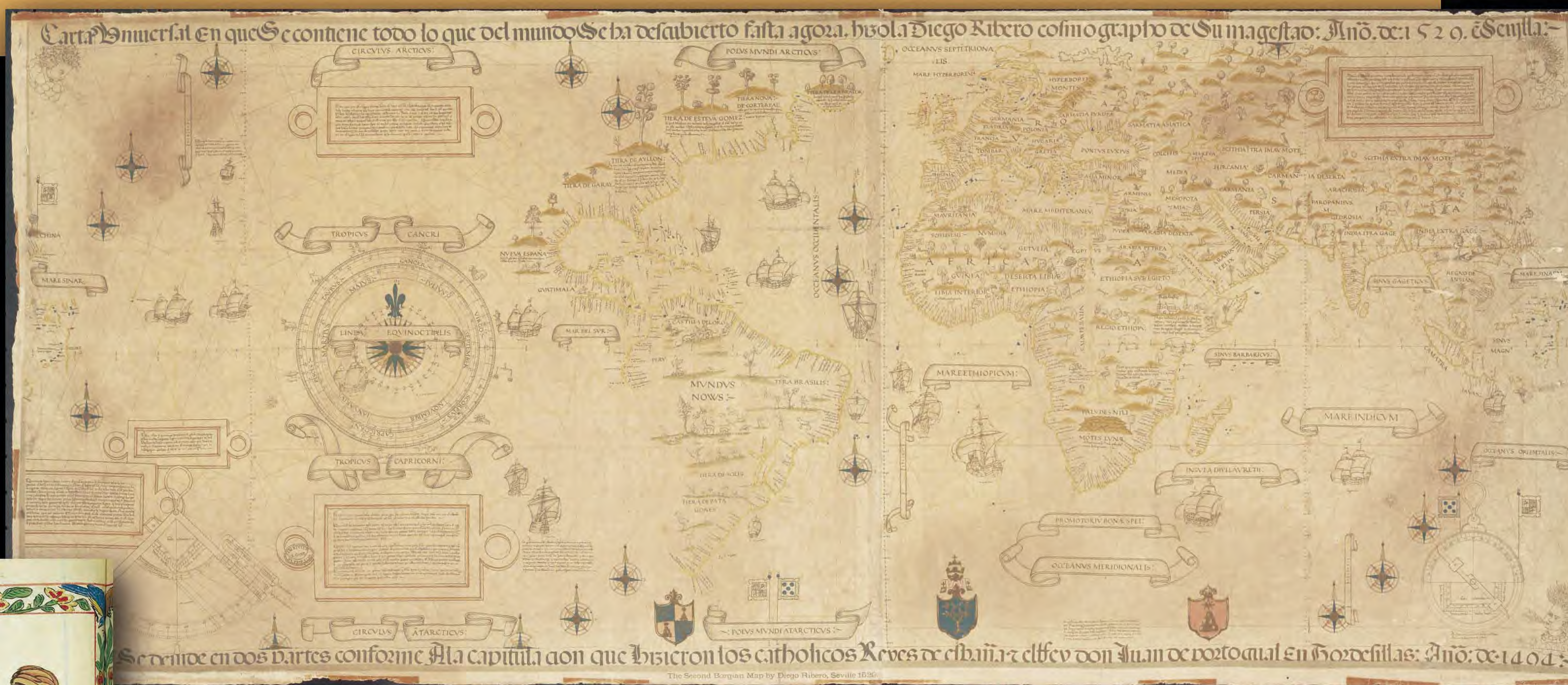
Diego de Ribero "Carta Universal" (1529), Biblioteca del Congreso, Washington D.C

Con los barcos repletos de riquezas, se hacen a la mar. Nada más zarpar, la nao Trinidad, tiene que dar la vuelta para ser reparada; posteriormente sería apresada por los portugueses. La Victoria, al mando de Juan Sebastián Elcano, se queda sola en la ruta de regreso hacia el oeste. En marzo de 1522 llega al cabo de Buena Esperanza con muchísimas dificultades y el 9 de julio a la isla de Cabo Verde. Desde allí Juan Sebastián Elcano desplegó velas rumbo Noroeste en dirección a las Azores. El 6 de septiembre de 1522 completó la primera circunnavegación al llegar al puerto de Sanlúcar de Barrameda.