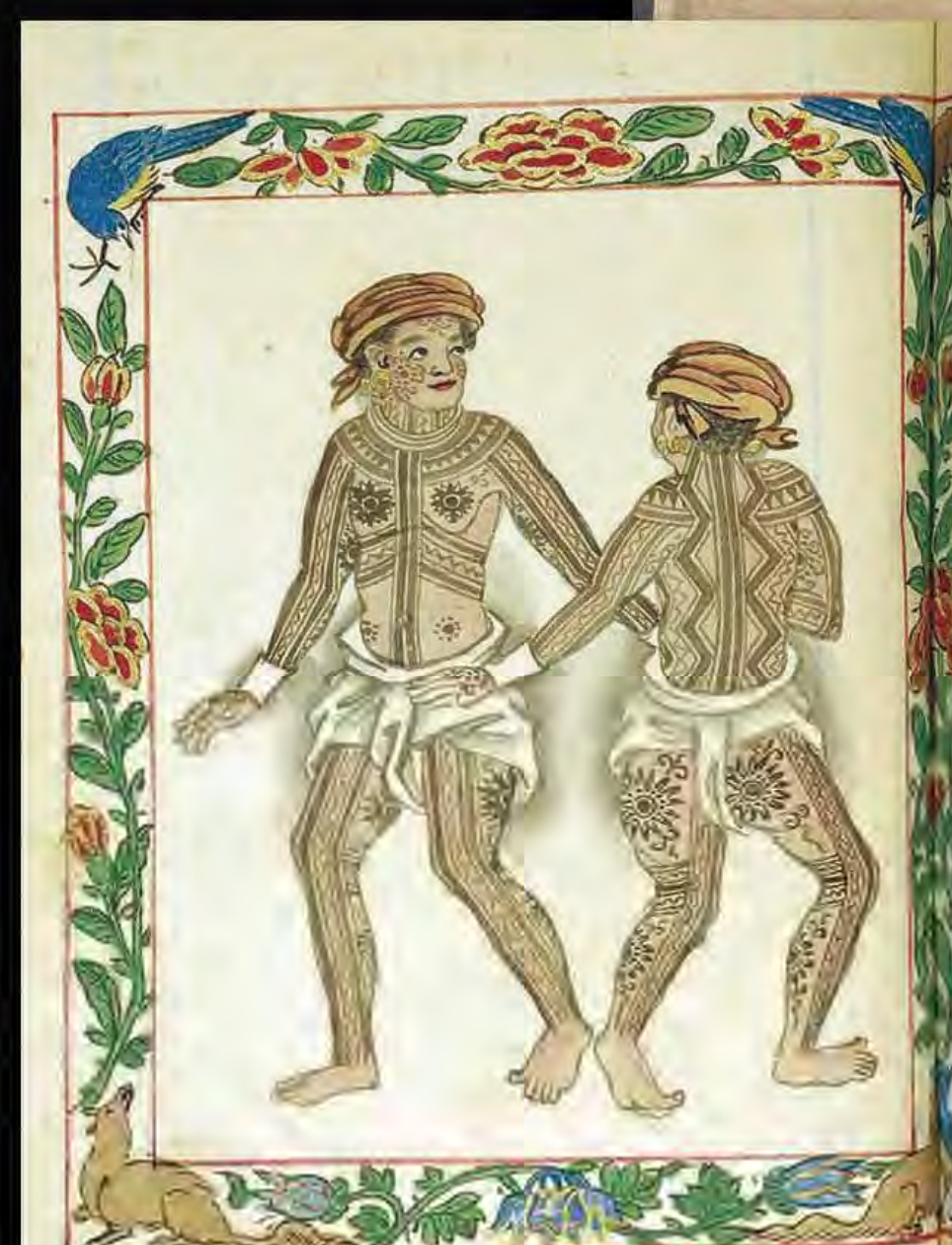
"Pintados de Visayas" (1590), Boxer Codex, Universidad de Indiana