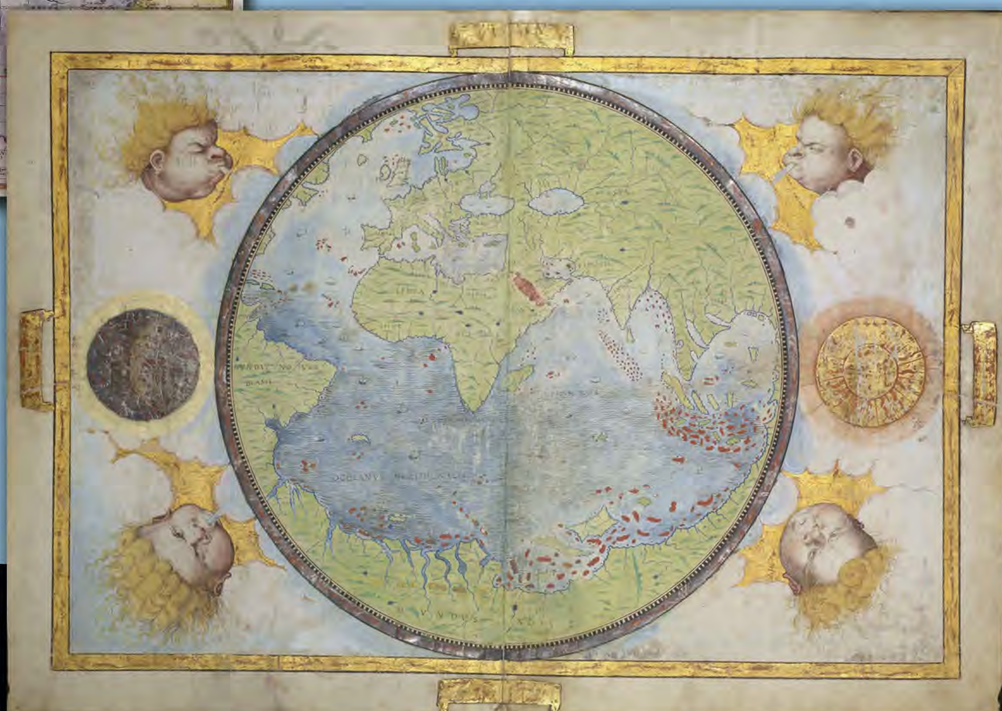
Pedro a Lopo Homem "Atlas Náutico del Mundo" (1519), Biblioteca Nacional de Francia