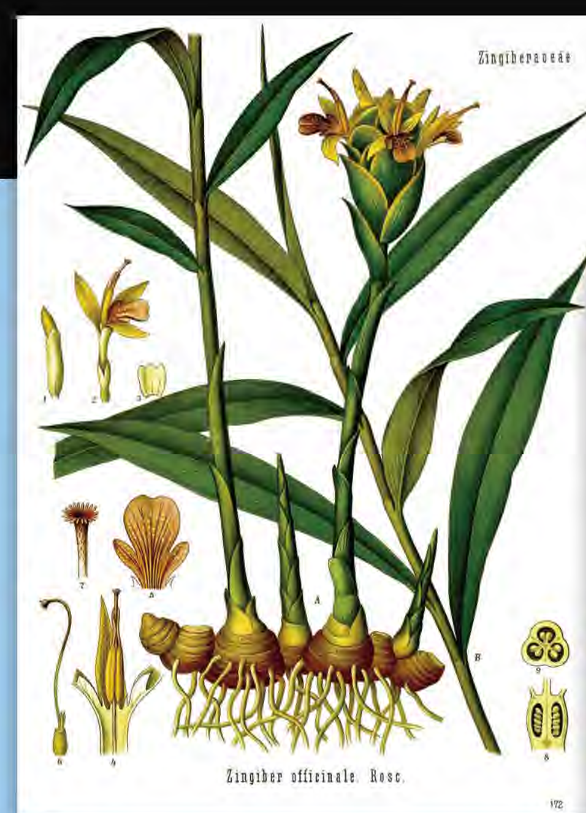
Jengibre ( Zingiber officinale ), Köhler (1887)