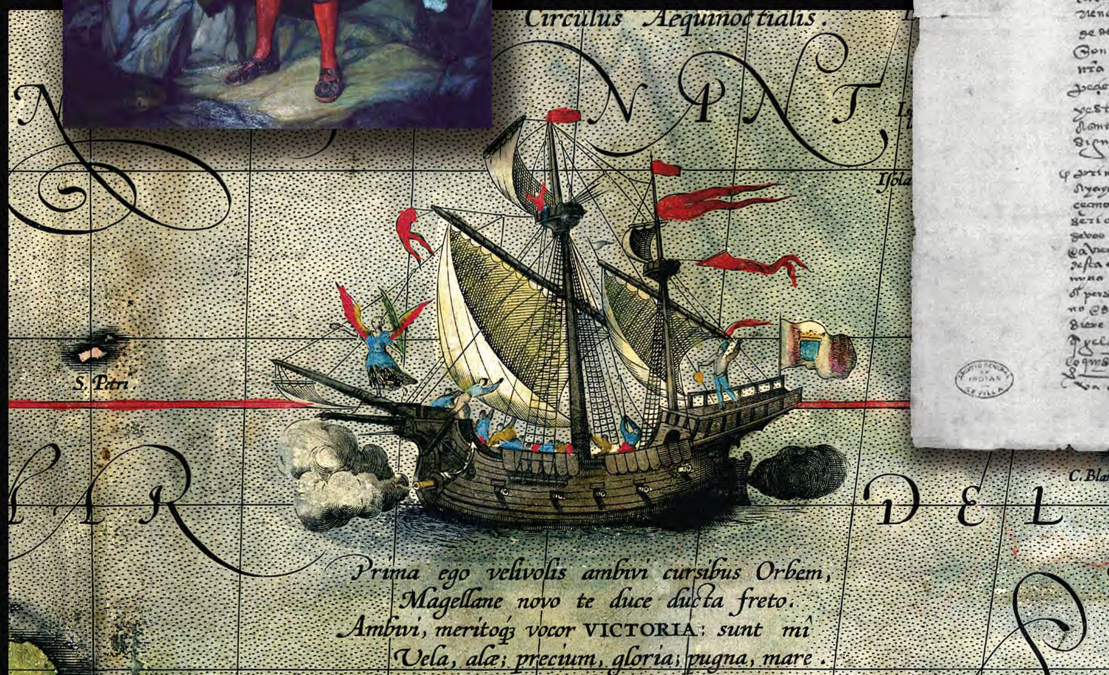
Abraham Ortelius "La Nao Victoria" (1589)