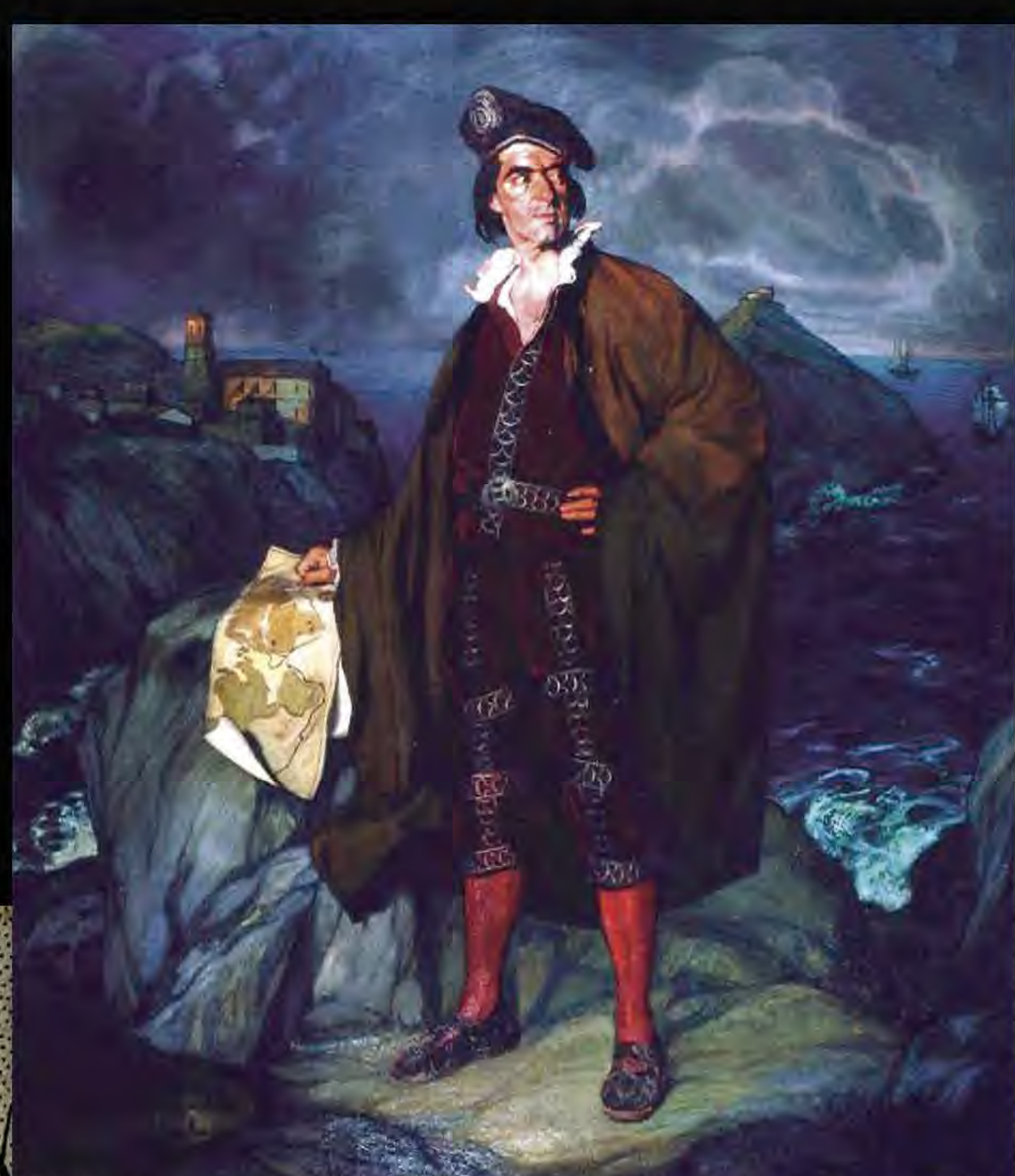
Ignacio de Zuloaga "Juan Sebastián Elcano" (1922), Diputación de Gipuzkoa

El 6 de septiembre de 1522, Juan Sebastián Elcano completó la primera circunnavegación al llegar al puerto de Sanlúcar de Barrameda en la nao Victoria, con 18 hombres, de los 245 iniciales, y con un cargamento de 27 toneladas de clavo de olor, cuyo valor compensaba con creces el coste de la aventura. Había dado la primera vuelta al mundo, demostrando la esfericidad de la tierra.