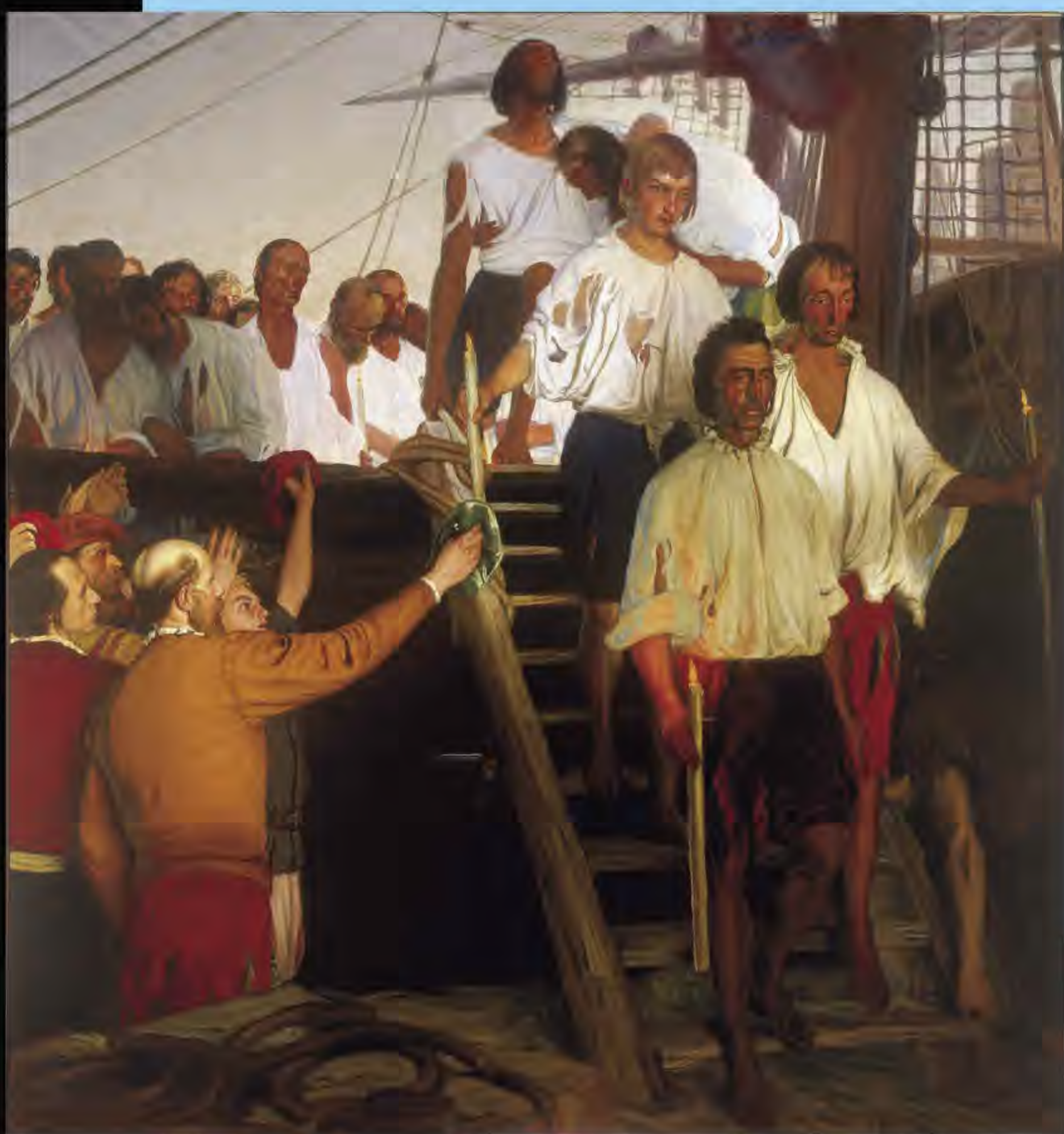
Elías Salaverría "El regreso de Juan Sebastián Elcano a Sevilla" (1919), Museo Naval de Madrid