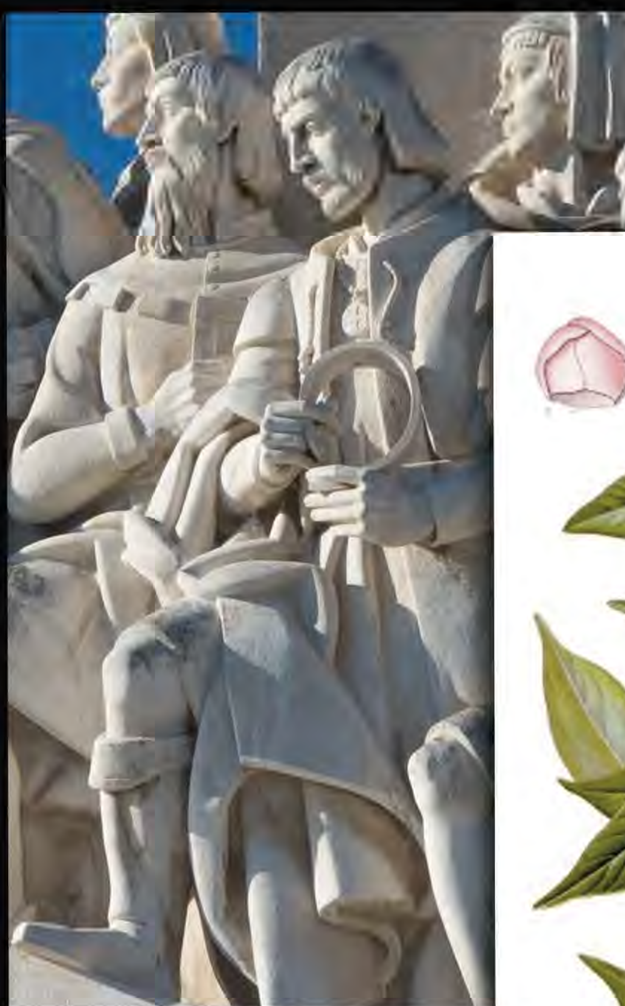
Leopoldo de Almeida "Fernando de Magallanes" (1960), Lisboa