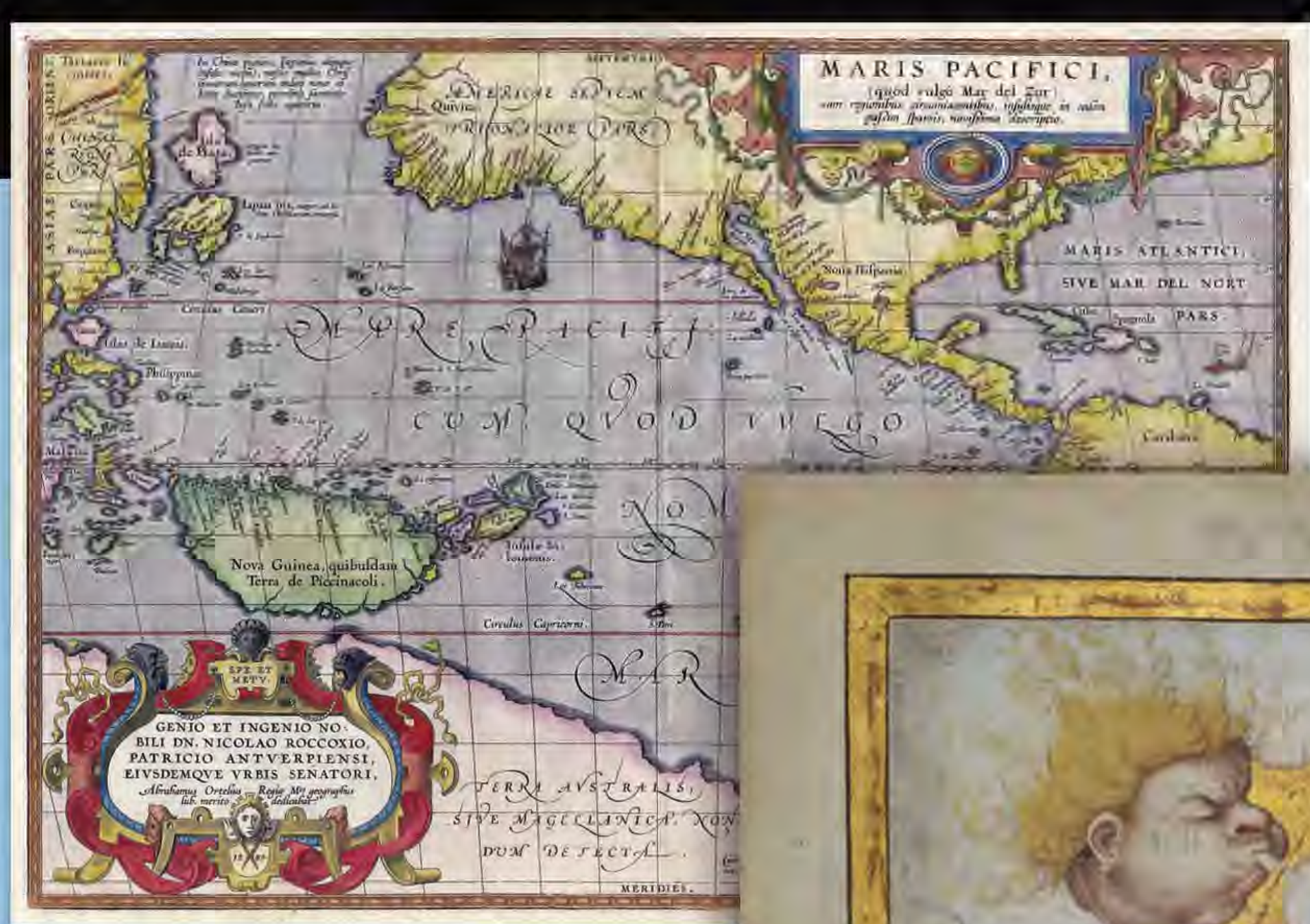
Abraham Ortelius "Mare Pacifici" (1589)