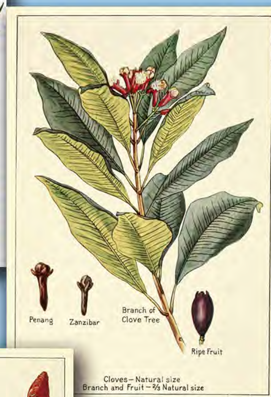
Clavo de olor ( Syzygium aromaticum ), McCormick (1915)