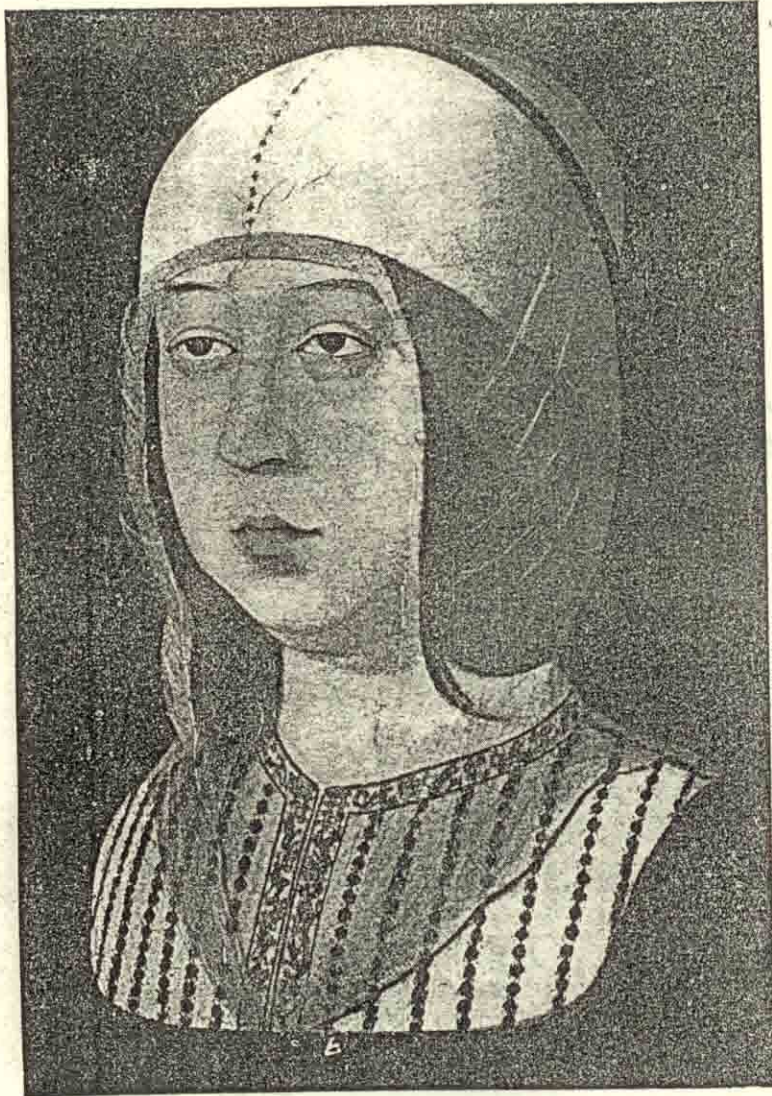
Isabel la Católica (Tabla de autor desconocido).